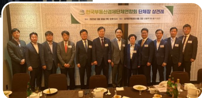
▶ 2023.03.30 한국부동산경제단체연합회 단체장 상견례 in 상제리센터 A동 2층