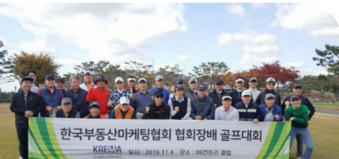
▶ 2019.11.04 골프동호회 활동 in 88컨트리 클럽