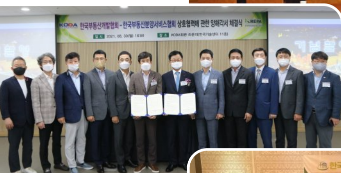
▶ 2021.08.30 개발협회 MOU in KODA회관