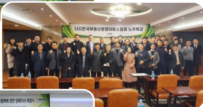
▶ 2020.02.06 노무특강 in 건설회관